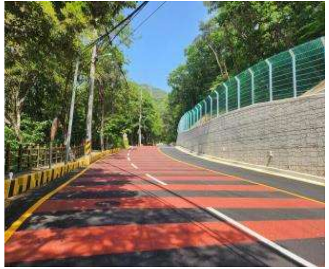
개선 후(보도폭 확장 및 옹벽설치)