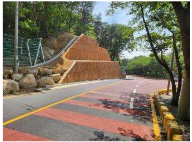
개선 후(보도폭 확장 및 옹벽설치)