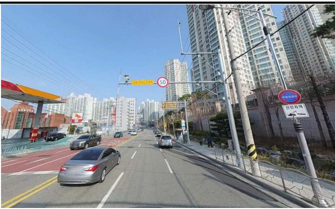
도로 사진(3차로 구간)